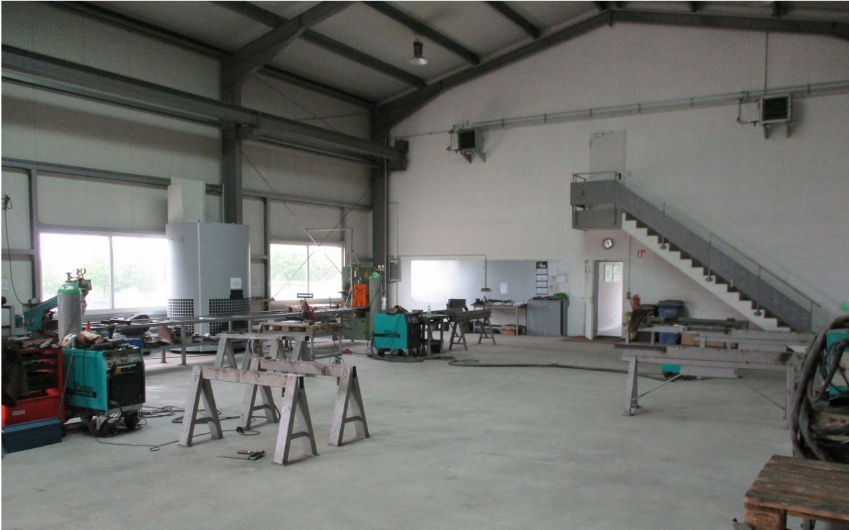
Fertigung / Stahlbau – Zugang Umkleidebereich