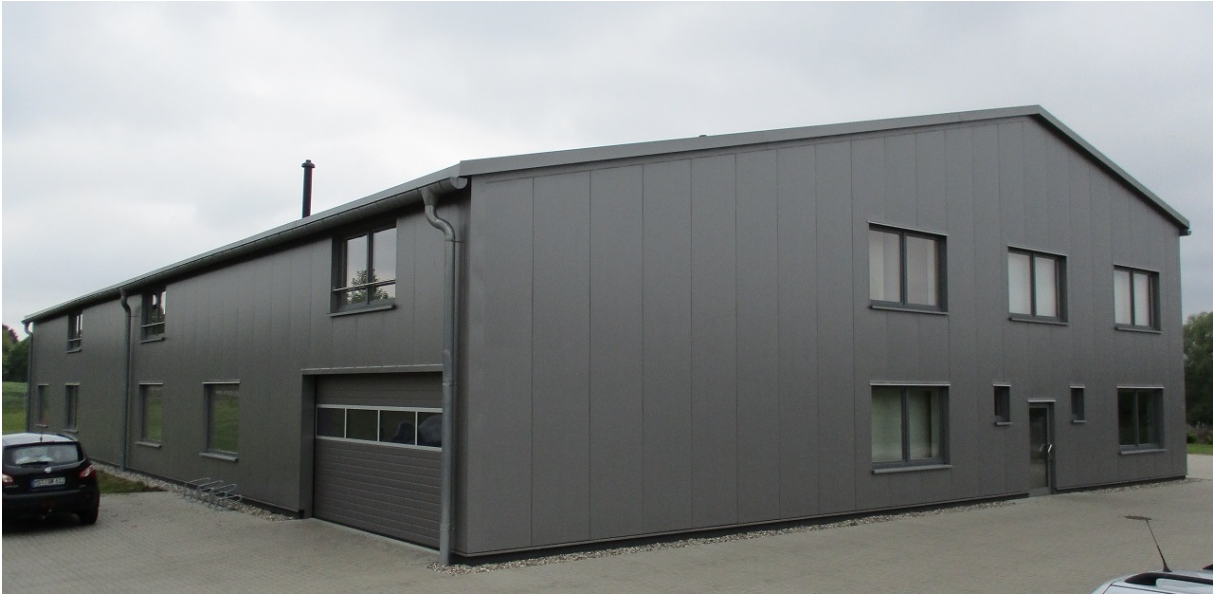
Hallenansicht Büro/Edelstahl- und Aluminiumfertigung