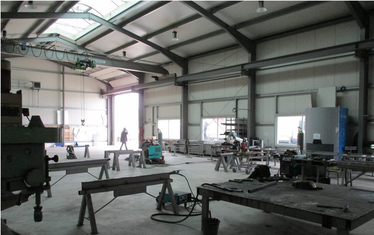
Fertigung / Stahlbau